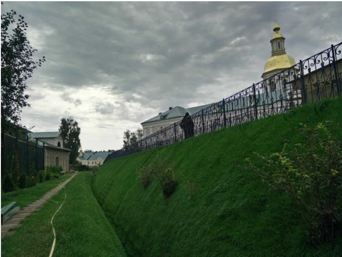
Рис. 1. Современный вид рва и вала БК